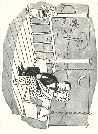
„Zey, ben ik soms teveel, zey het dan!”